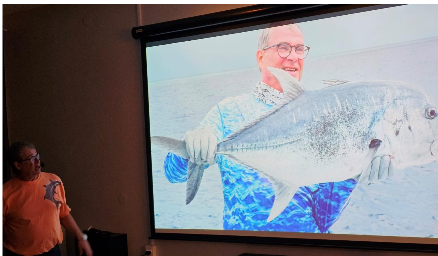
Ett styrkeprov att landa en sådan fisk