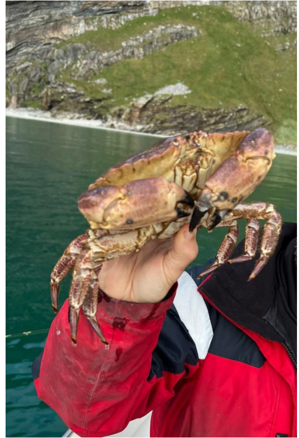
En sådan kan ibland nypa fast på betet