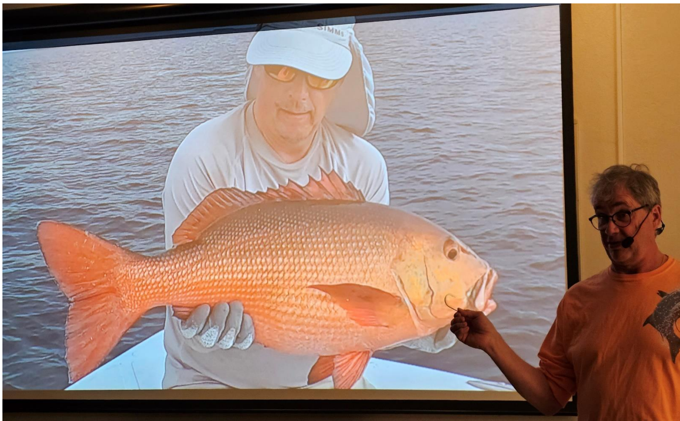
En av arterna som fastnade på kroken