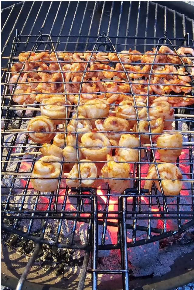
Här grillas rullar av rödspätta och räkor på spett