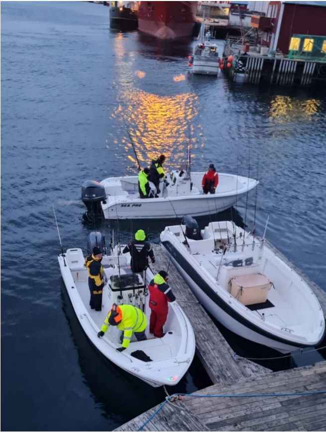
Hamnen och några båtar på väg ut